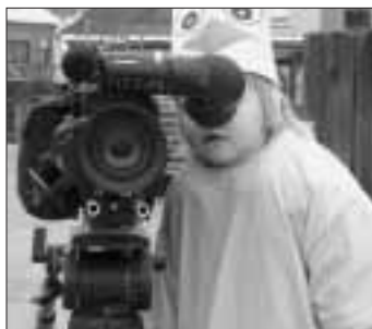
Klein geleerd, is groot gedaan.

Er zit beweging in. Het fijne aan een totaalspektakel is dat zoveel mensen tegelijk aan het werk gezet worden. Er is de laatste dagen hard gewerkt, niet alleen tijdens de repetities, maar ook aan de administratieve kant van ons project. Het voorbereiden van de kaartenverkoop maakte de nacht van maandag op dinsdag een stuk korter, 't was leuk, maar we zijn nog lang niet klaar.