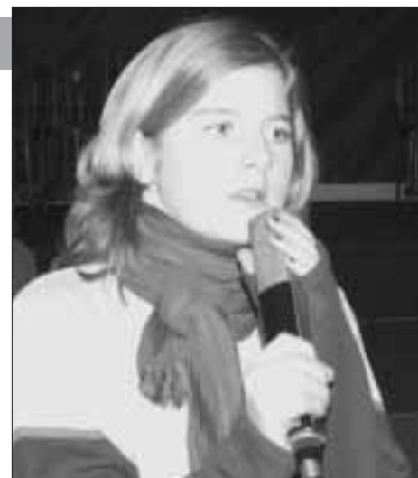
NegaTina: een geval apart, een droomrol.

Je hebt toch wel een zware rol, je bent constant op het podium, je loopt overal tussen, je zingt je de ziel uit het lijf... Heeft Tina geen plankenkoorts? "Nu nog niet maar de avonden zelf zal ik wel bangelijk zenuwachtig zijn. 't Is niet omdat ik vaak een grote mond hebt, dat alles zomaar vanzelf gaat. Ik vind het een heel toffe rol en ik zal me helemaal geven om de beste prestatie neer te zetten, al komt er toch niemand kijken! (grapje)"