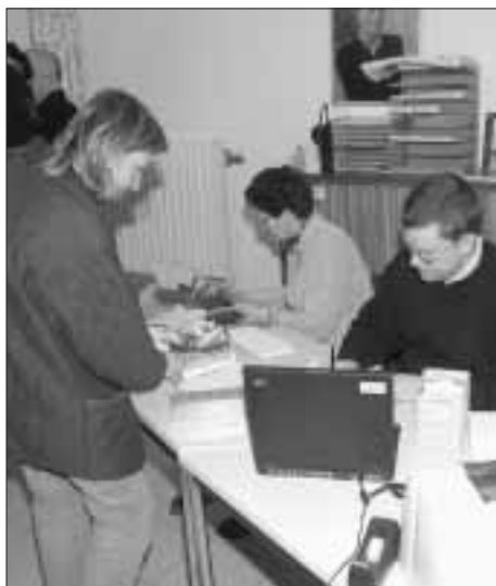
Het oudercomité zorgt voor een vlotte kaartenverkoop.

Wie nog kaarten wenst, komt naar het verkooploket op school, dinsdag en vrijdag van 16 uur tot 18 uur, en zaterdag van 10 uur tot 12 uur. U kan ook bestellen via E-mail: kaarten@7sleutels.be . Een genummerde toegangkaart kost € 7.