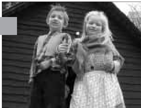
Tweede kleuterfilmpje met veel smaalt ingeblikt.

Ook de beenhouwerij van de plaatselijke AD Delhaize droeg haar steentje bij. Ze bezorgden ons een schitterende varkenskop, die prachtig versierd werd met allerlei groenten. Deze zal je zeker in het sprookje kunnen bewonderen.